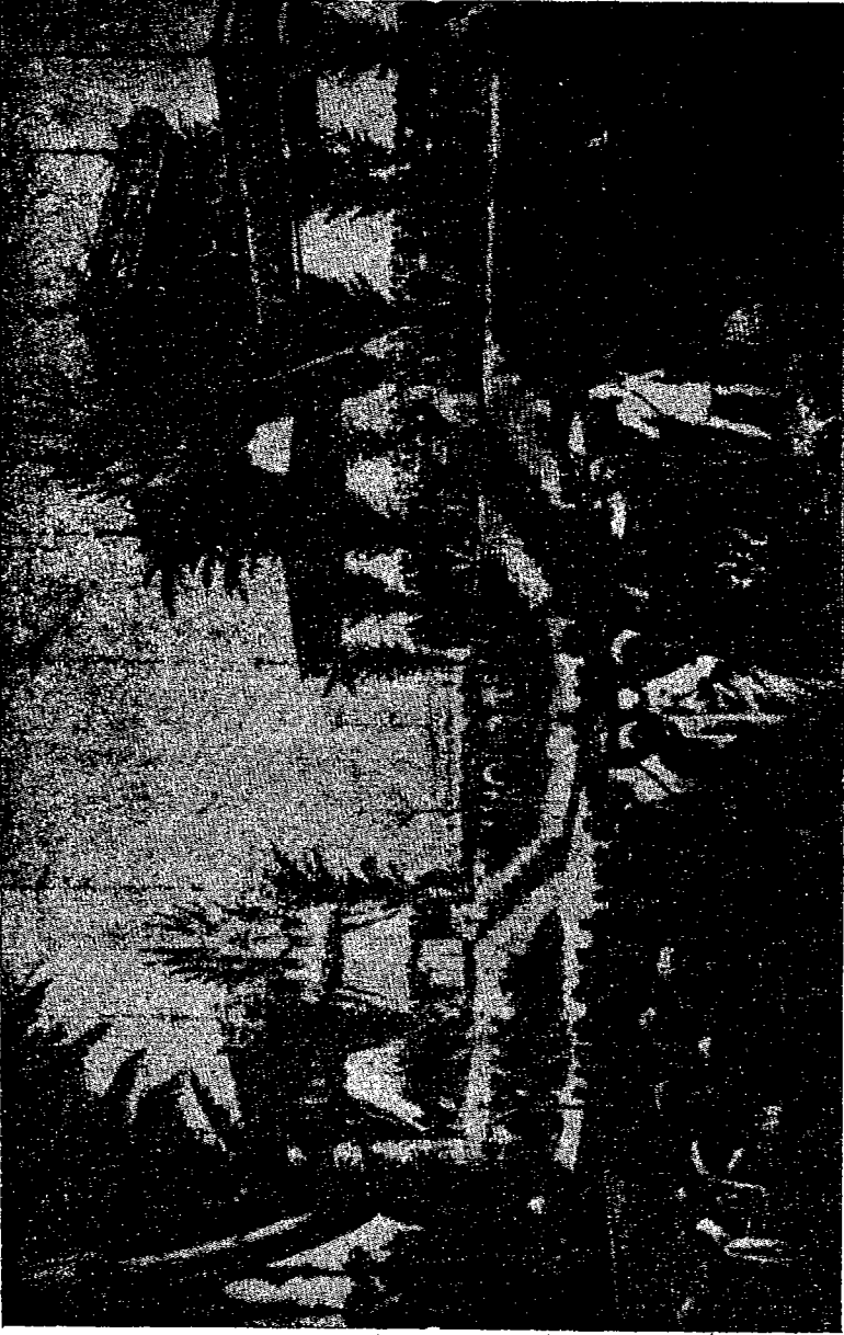
الإحتفال بافتتاح قناة السويس في بود سعيد يوم ١٦ نوفمبر ١٨٦٩